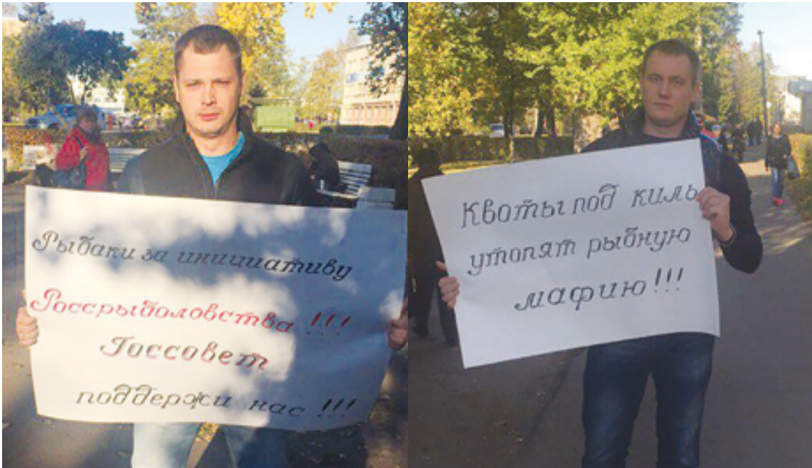
▲ Подпольщики из «Рыбаков России» действуют