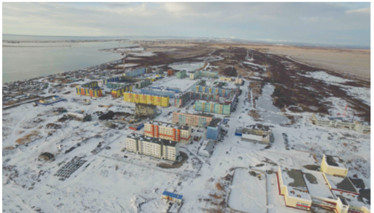
▲ Усть-Камчатка, микрорайон Погодный