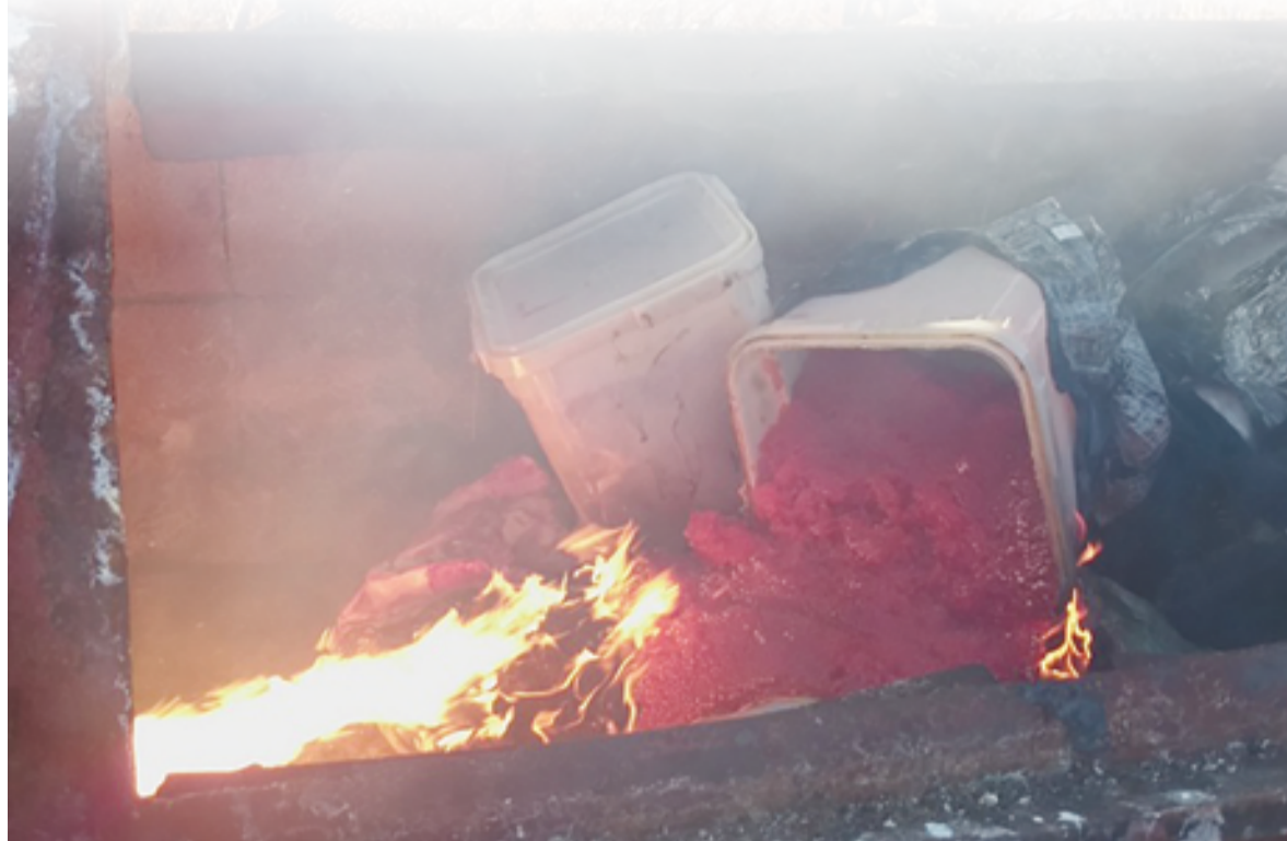
▲ Изъятая у общины икра, скорее всего, будет уничтожена

За 10 дней, пока шло дознание, ни пограничники, ни полиция не нашли в икре криминала. Они убедились, что у общины есть участок, есть разрешение на промысел, есть