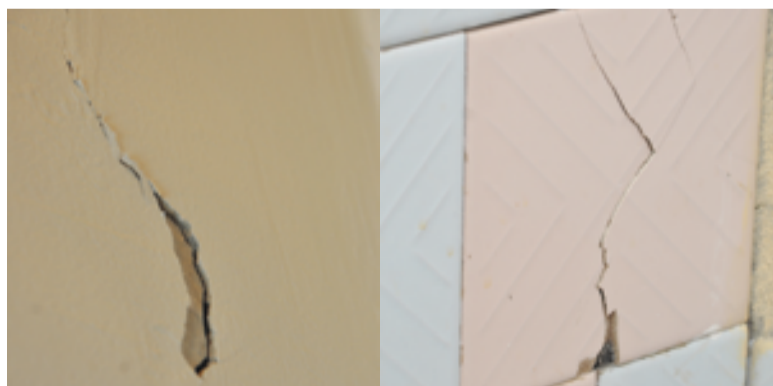
▲ После землетрясения во многих зданиях появились трещины в стенах

Р. С. В ночь на 13 ноября у восточного побережья Камчатки произошло новое землетрясение магнитудой 5,4. Эпицентр находился в 70 километрах к востоку от бухты Вестник на глубине 68 километров под морским дном. В населенных пунктах, включая Петропавловск (150 км от эпицентра), существенных подземных толчков не ощущалось.