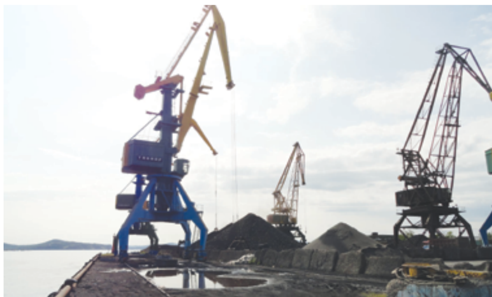
▲ Так выглядит м. Сигнальный в наши дни