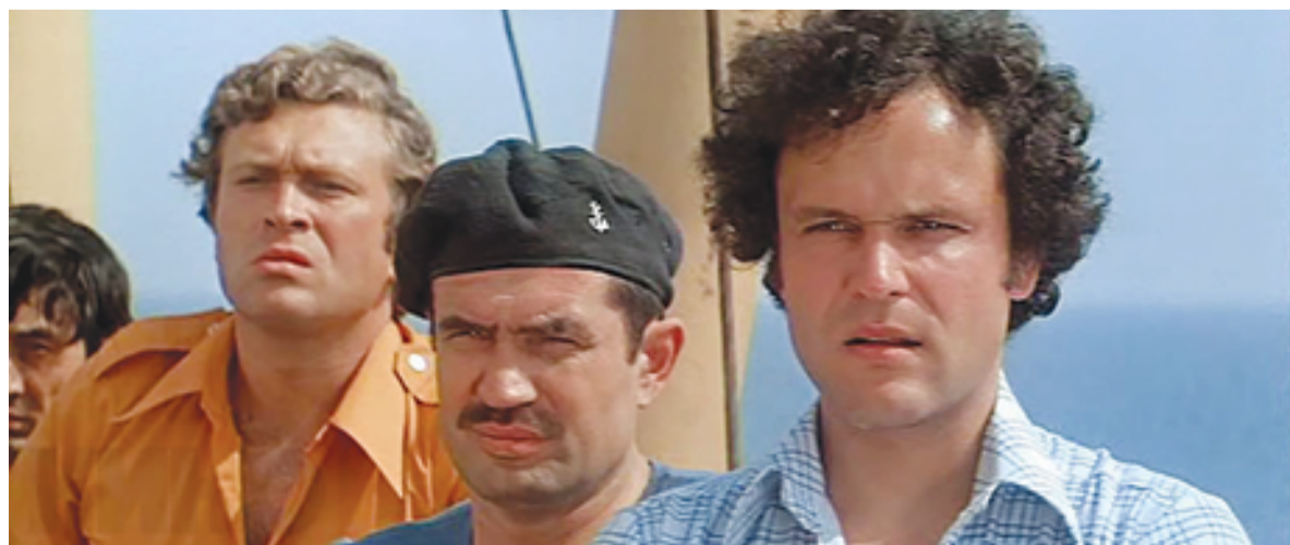
▲ Миллионы советских мальчишек мечтали повторить подвиги героев фильма «Пираты XX века»