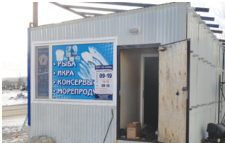
Строительство рыбного магазина на ул. Гришечко

«41 регион» сам заинтересован в том, чтобы начать торговлю в Елизове. Ведь именно там находится завод ООО «РПЗ «Сокра», на базе которого возникла торговая сеть. У предприятия есть магазин в Елизове, но вдалеке от жилой застройки, на ул. Магистральной в районе 29 километра. Его рас-