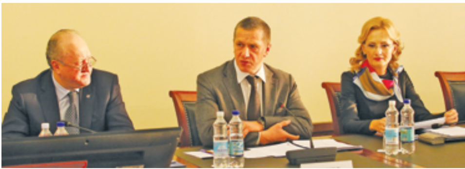
▲ Ю. Трутнев ведет совещание по вопросу ТОР «Камчатка»

Государство выделит средства на реконструкцию причалов на м. Сигнальном под прием круизных лайнеров, а четыре причала в ковше перейдут в собственность края. Эти и другие решения достигнуты в ходе визита на Камчатку Ю. Трутнева