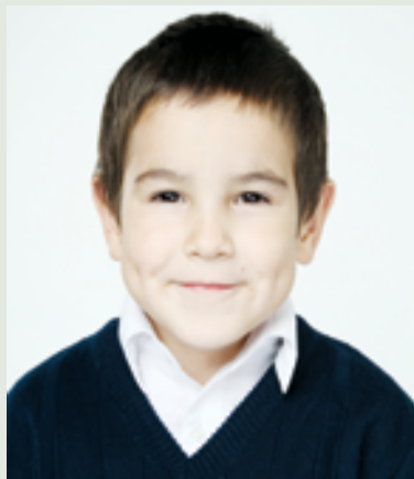
▲ Алмаз, 2007 г. р.