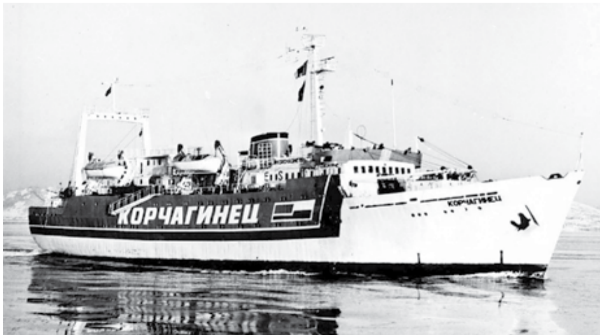
▲ Агиттеплоход «Корчагинец»