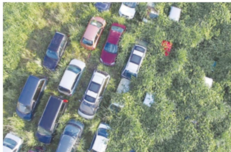
▲ Брошенные автомобили на дороге возле АЭС поглотила природа

Цунами спровоцировало колоссальную утечку радиоактивной воды. Американские санитарные службы обнаружили следы радиации в мясе тунцов, пойманных у берегов Калифорнии. По мнению биологов, рыба, в организме которой был обнаружен цезий, добралась от места трагедии до США за три-четыре месяца.