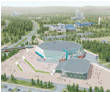
НОВЫЙ ЛЕДОВЫЙ ДВОРЕЦ СКОРО УКРАСИТ КРАЕВУЮ СТОЛИЦУ