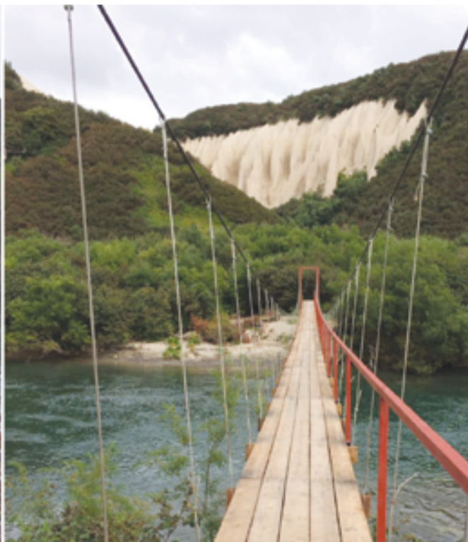
▲ Мост на Кутхины Баты

ФГБУ «СЕВВОСТРЫБВОД» – ГОСУДАРСТВЕННОЕ СПЕЦИАЛИЗИРОВАННОЕ УЧРЕЖДЕНИЕ С 70-ЛЕТНЕЙ ИСТОРИЕЙ