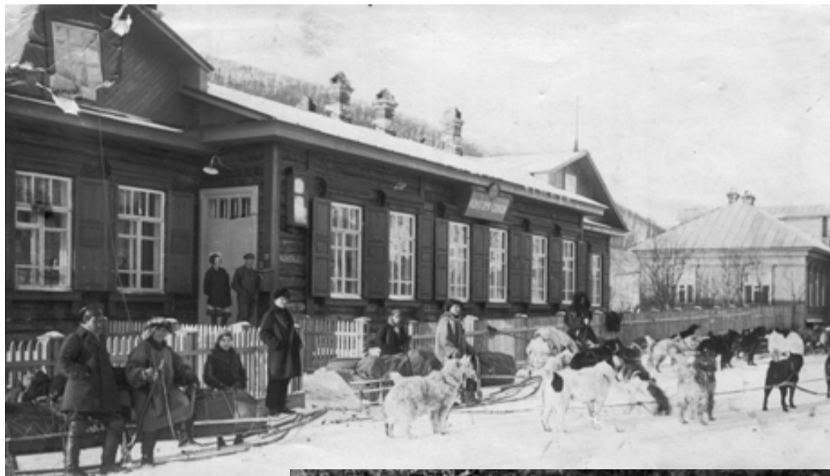
▲ Здание почты в центре города, 1920-е

«Рыбак Камчатки» продолжает публиковать летопись Петропавловска, старательно собранную по крупице, по строчке камчатским писателем Сергеем Гавриловым