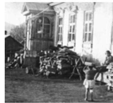
▲ Ул. Партизанская, 1930-е

почтово-телеграфной конторы», и, естественно, АКО. Склады общества располагались по соседству с почтой.