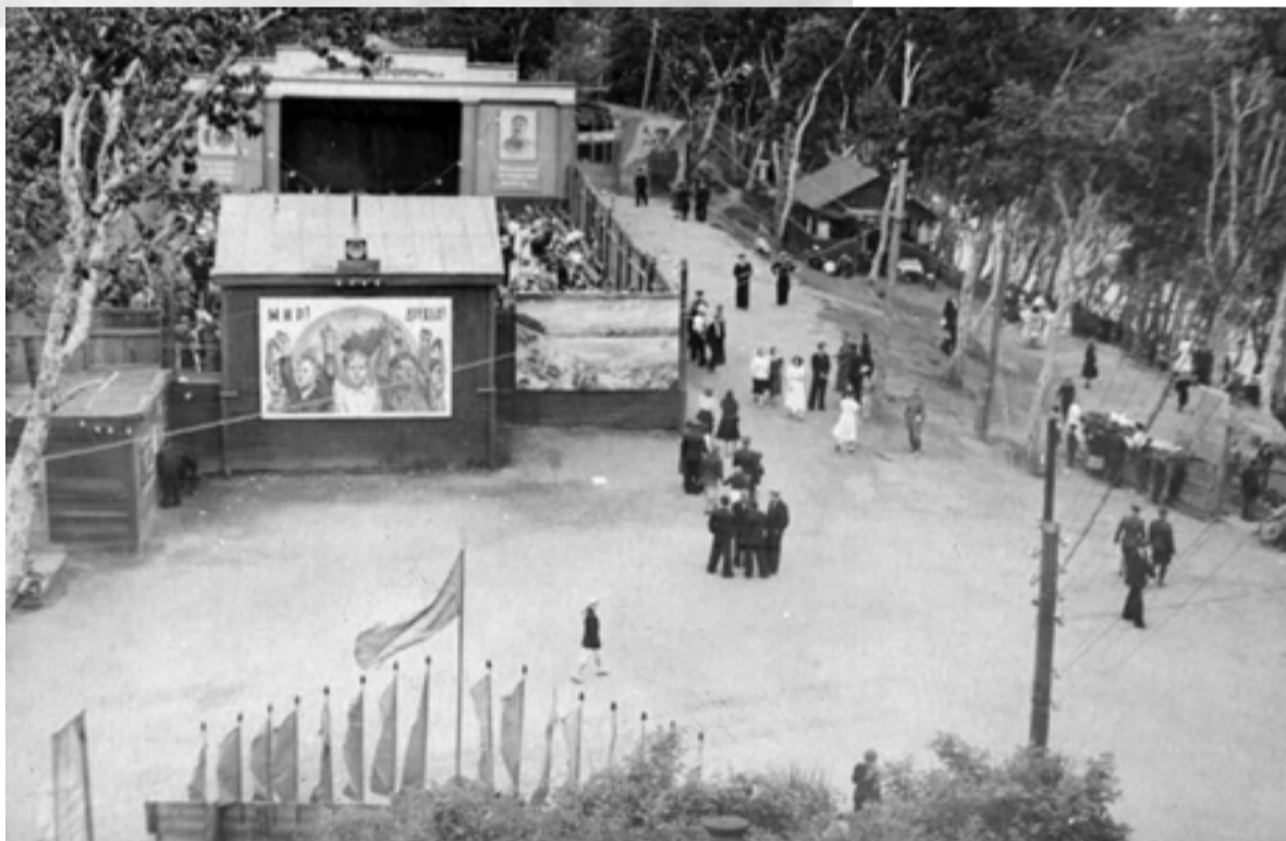
▲ Никольская сопка, 1930-е

Жилье силами города не строилось. Все новые здания возводились различными ведомствами. Первенствовали здесь наркомат почты и телеграфа (Наркомпочтель), соорудивший для своих работников четырехквартирный дом и сделавший «капвложения в постройку