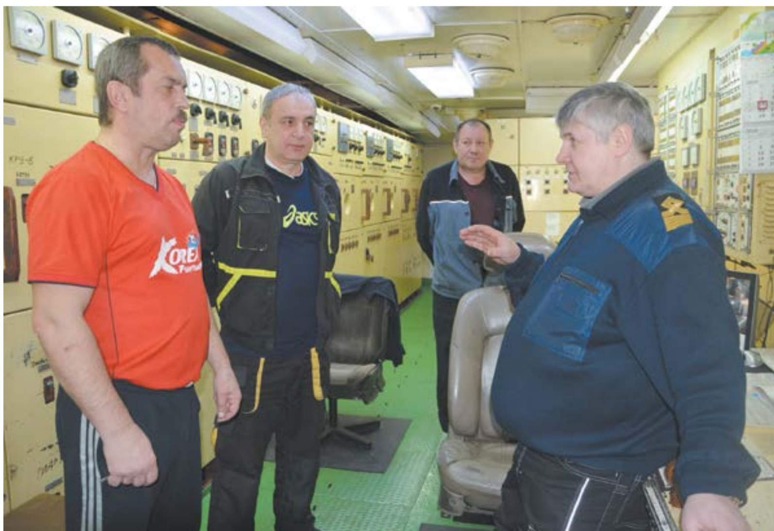
▲ Машинное отделение

«После окончания школы я отправил запросы во все морские училища страны. Первое приглашение пришло из Владивостока. Туда и поехал. Было все равно куда,