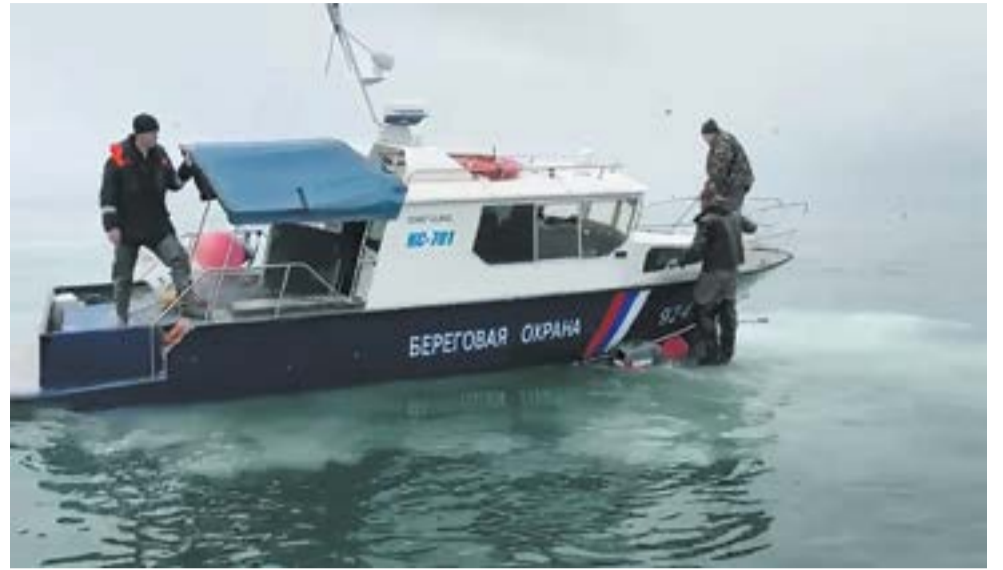
▲ Ролик о конфликте рыбаков и пограничников обошел все существующие соцсети