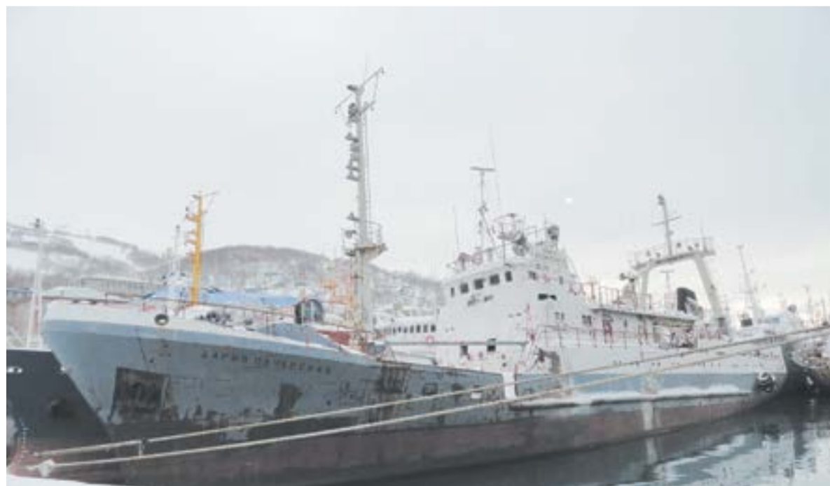
▲ Бывшее судно «Нацрыбресурсов» «Дарья Печерская» почти 9 лет простояло на Камчатке без работы и охраны

Р. S. Когда готовился этот материал, стало известно, что Федеральное агентство по рыболовству обратилось в Минпромторг и Минфин с предложением субсидировать строительство двух крупнотоннажных траулеров для добычи криля в Антарктиде. Речь идет о субсидии в 6 млрд рублей (это примерно треть стоимости строительства). Какая компания возьмется за этот масштабный, но весьма рискованный проект, пока неизвестно. Может быть, это будет АО «Национальные рыбные ресурсы»? <