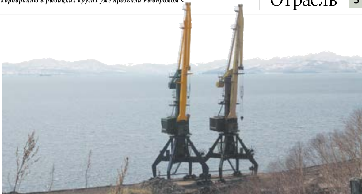
▲ В ведении «Нацрыбресурсов» на Камчатке – причалы в центре Петропавловска и в б. Моховая